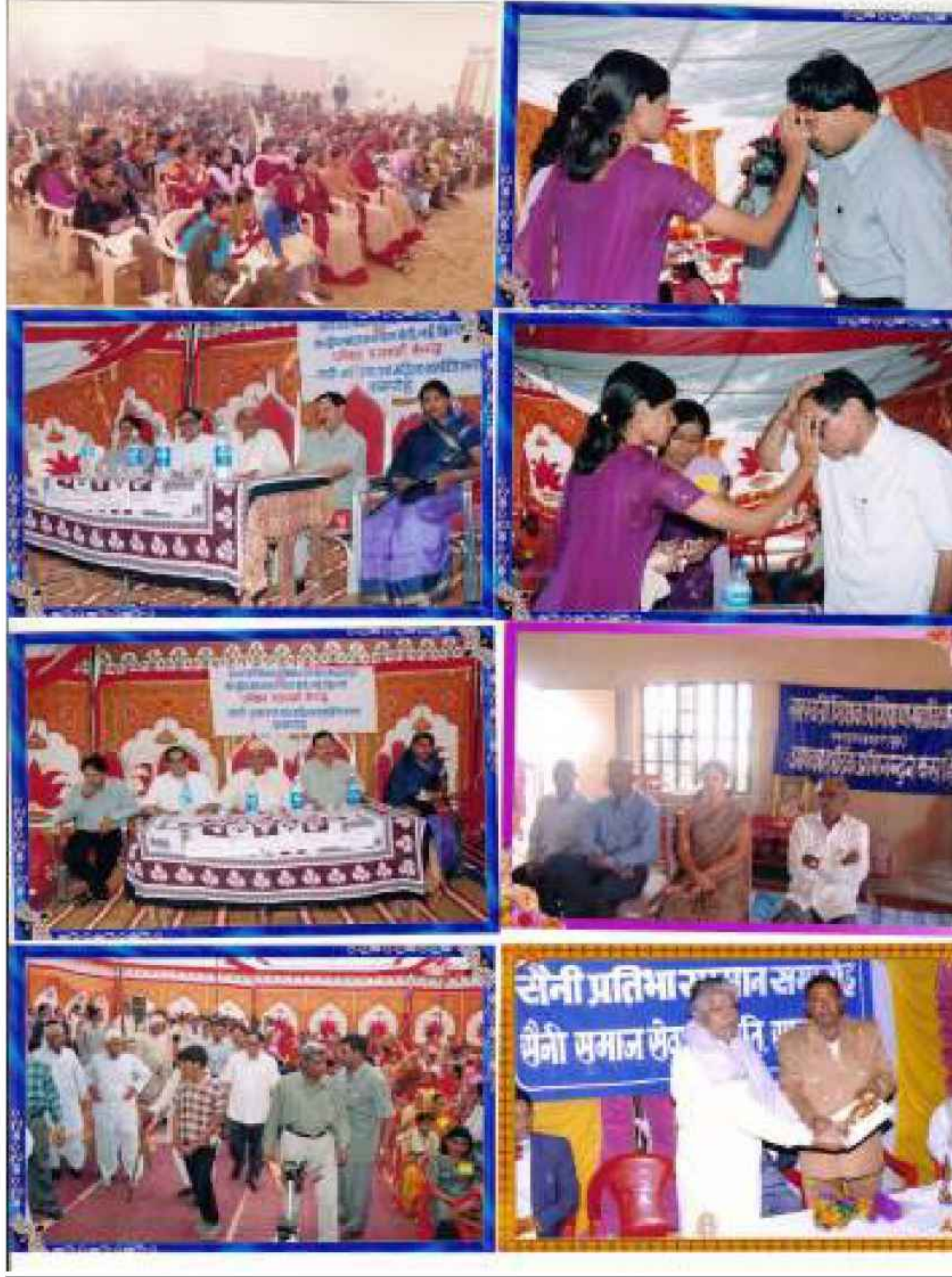
Talent Award Program and Women Empowerment Awareness Program

Website : saraswatitcollege.com , E-mail : sttcollegesds@rediffmail.com