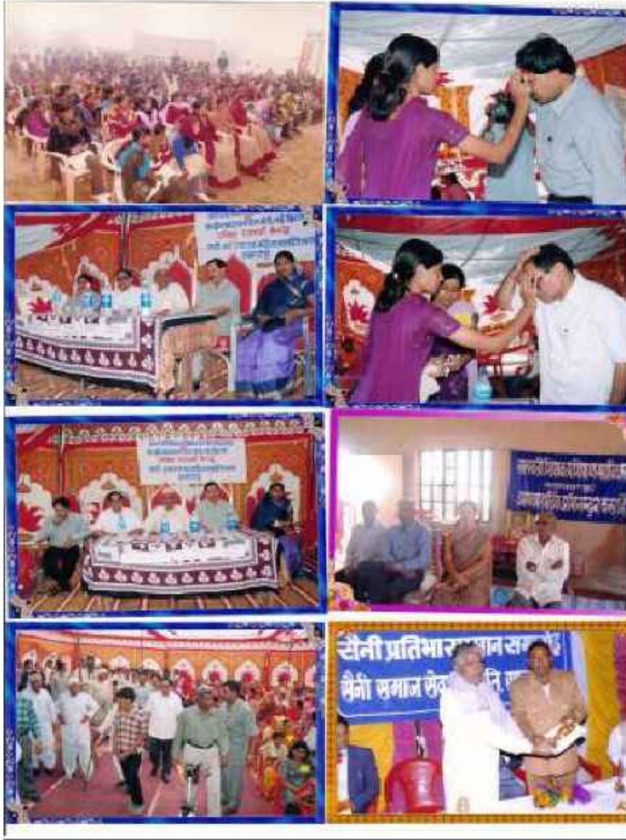
Talent Award Program and Women Empowerment Awareness Program

Website : saraswatitcollege.com, E-mail : sttcollegesds@rediffmail.com